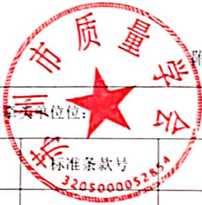
附表团体标准征求意见汇总处理表