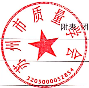
附表 团体标准送审稿函审结论表