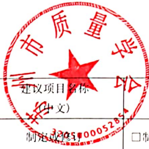
附表：团体标准立项申请书