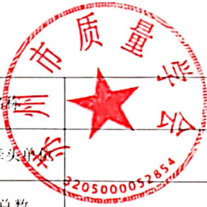
附表 团体标准送审稿函审单