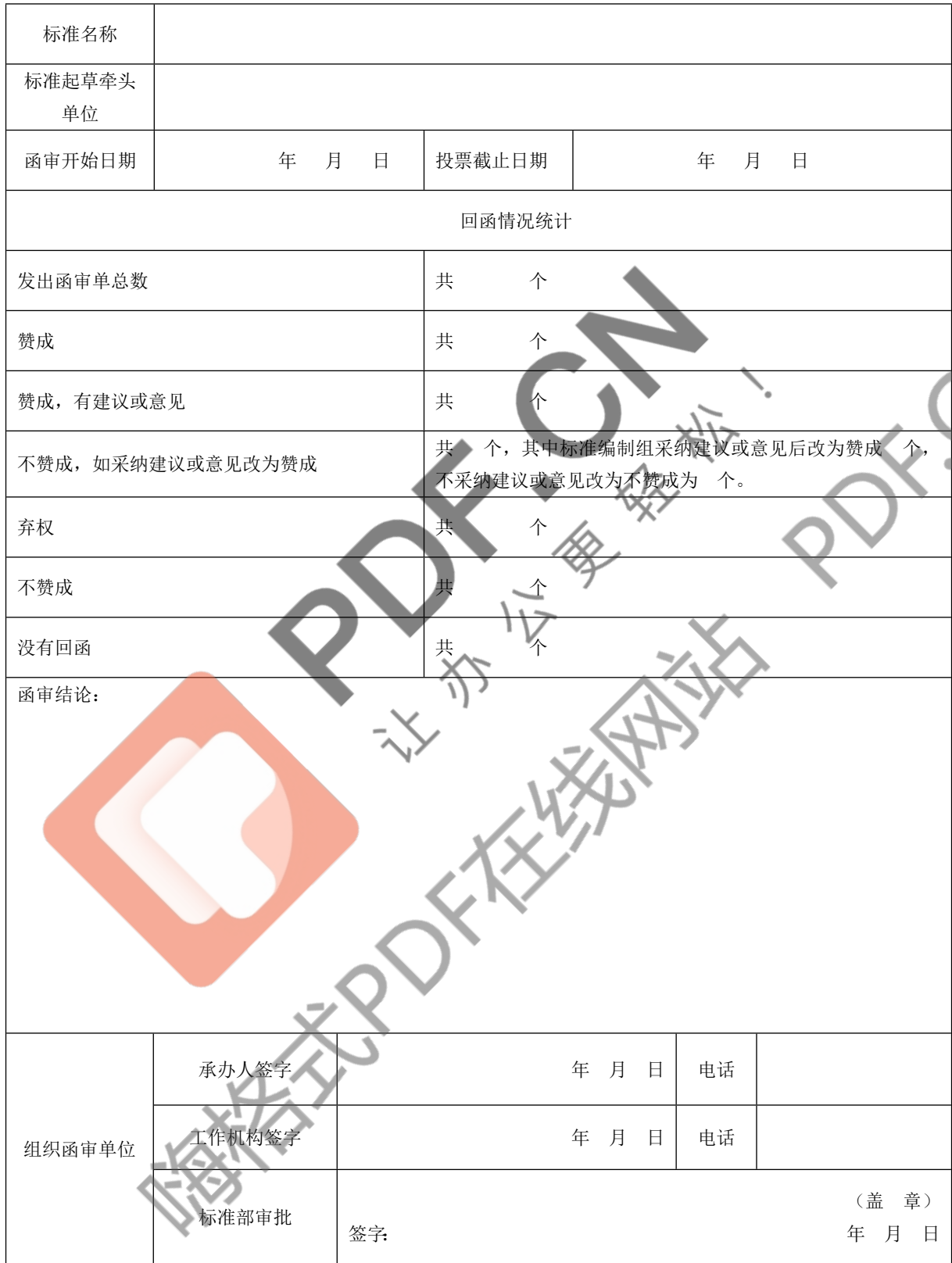
附表 团体标准送审稿函审结论表