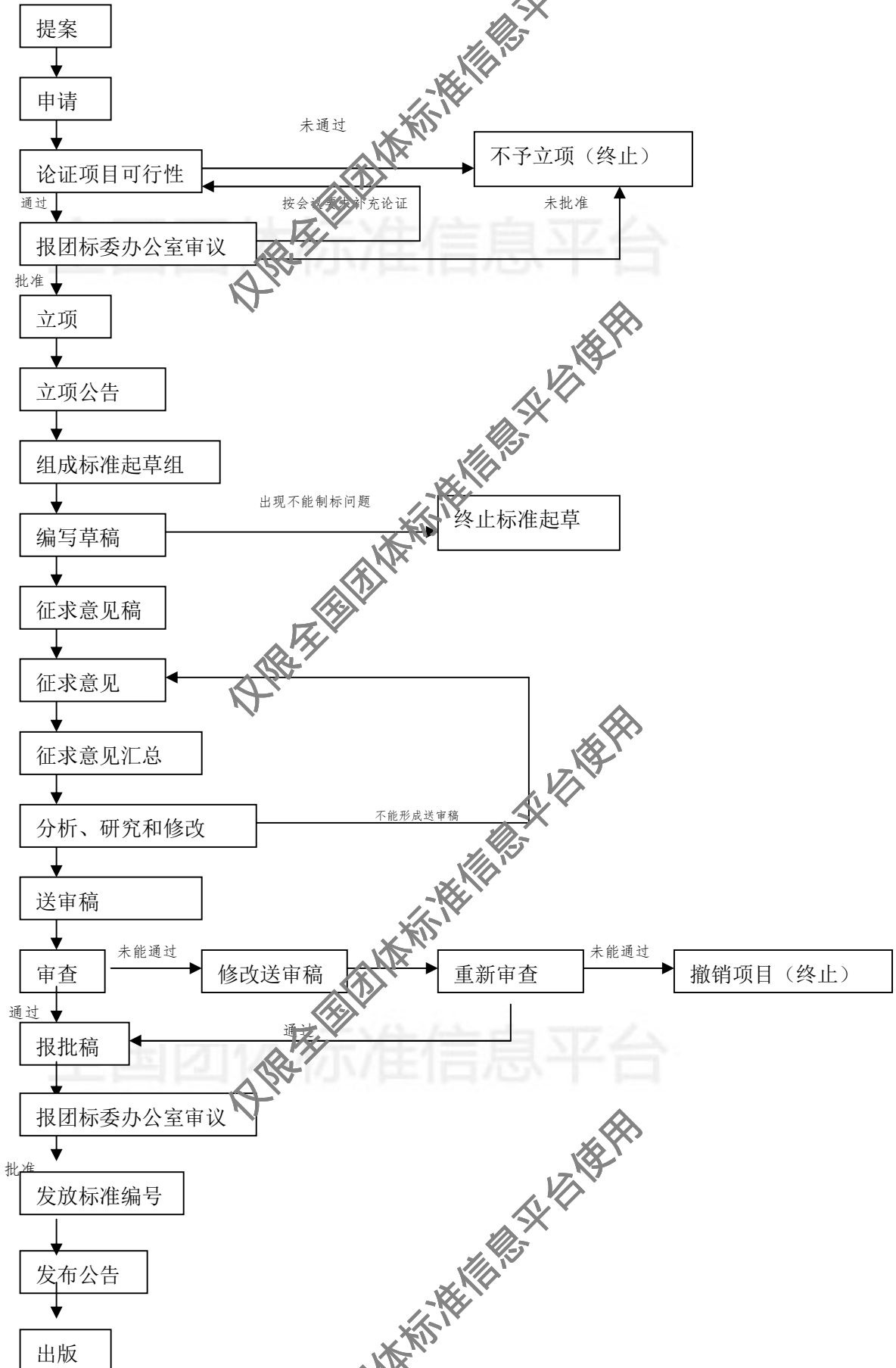
附件 1: 锦州市果业协会团体标准制定工作流程图